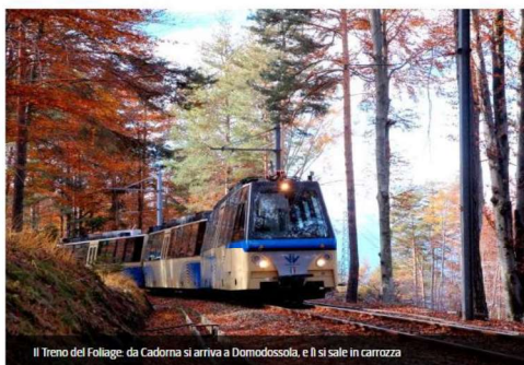
Il Treno del Foliage: da Cadorna si arriva a Domodossola, e lì si sale in carrozza

Panorami da cartolina, perfetti per una fuga romantica o una giornata di relax: le destinazioni fuori porta più suggestive ideali per le famiglie che amano la natura