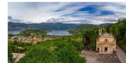
di Ameno, Santuario Madonna della Rocca.

Altro appuntamento con il brivido a misura di famiglia è al Parco Avventura Le Pigne, ad Ameno, sul lago d'Orta, dove venerdì 1 novembre dalle 14:30 alle 17:30 ci sarà "Halloween alle Pigne", evento durante il quale i più piccoli potranno divertirsi con un laboratorio di intaglio di zucche, e gli esploratori più coraggiosi partecipare ad un'avvincente caccia al tesoro