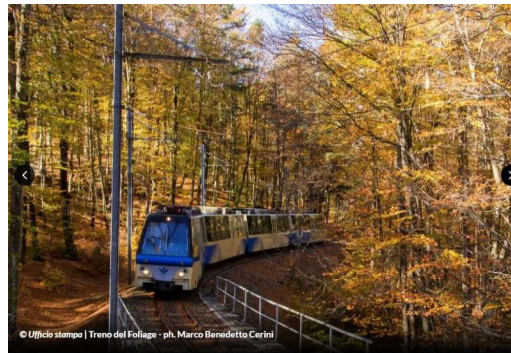
© Ufficio stampa | Treno del Foliage - ph. Marco Benedetto Cerini

Dal 12 ottobre al 17 novembre sui treni Vigevzina-Centovalli: un'esperienza da non perdere